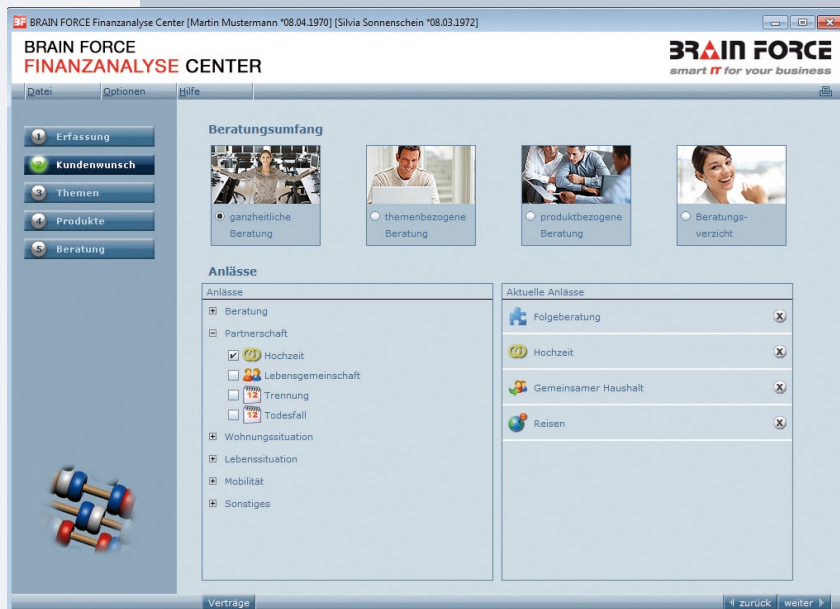
BRAIN FORCE Finanzanalyse Center

BRAIN FORCE Finanzanalyse Center ist leicht zu bedienen. Aufgrund des selbsterklärenden und intuitiven Handlings ist nur ein geringes Training der Anwender erforderlich. Wir schulen Ihre Vertriebsmitarbeiter gerne in der Benutzung von BRAIN FORCE Finanzanalyse Center – fragen Sie uns!