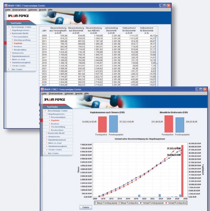
Übersichtliche Darstellung der Basisrente (oben) und der Abgeltungsteuer (unten).

Sowohl der Staat wie auch der Arbeitgeber bieten verschiedene Fördermöglichkeiten wie Steuervorteile und Zulagen, die im Förder Center aufgezeigt werden. Die Analyse erfolgt nach Eingabe von Familienstand, Berufsart, Geburtsdatum, zu versteuerndem Einkommen sowie Anzahl der Kinder. Diese wird in einer Grafik übersichtlich aufbereitet, aus der Sie sowohl die Fördermöglichkeiten als auch maximal erzielbare Förderungen aufzeigen. Gemeinsam mit Ihrem Kunden können Sie dann eine Anpassung des Beitrags und eine Neuberechnung mit den veränderten Beiträgen erarbeiten und mit verschiedenen wählbaren Konfigurationen die Fördermöglichkeiten zu den Themen Altersvorsorge, Bausparen und Kapital ausweisen.