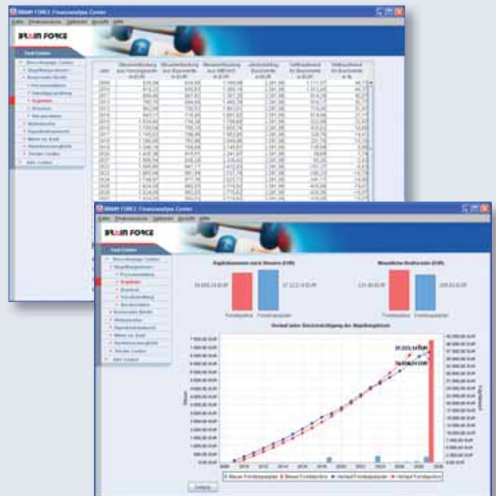
Übersichtliche Darstellung der Basisrente (oben) und der Abgeltungsteuer (unten).

Sowohl der Staat wie auch der Arbeitgeber bieten verschiedene Fördermöglichkeiten wie Steuervorteile und Zulagen, die im Förder Center aufgezeigt werden. Die Analyse erfolgt nach Eingabe von Familienstand, Berufsart, Geburtsdatum, zu versteuerndem Einkommen sowie Anzahl der Kinder. Diese wird in einer Grafik übersichtlich aufbereitet, aus der Sie sowohl die Fördermöglichkeiten als auch maximal erzielbare Förderungen aufzeigen. Gemeinsam mit Ihrem Kunden können Sie dann eine Anpassung des Beitrags und eine Neuberechnung mit den veränderten Beiträgen erarbeiten und mit verschiedenen wählbaren Konfigurationen die Fördermöglichkeiten zu den Themen Altersvorsorge, Bausparen und Kapital ausweisen.