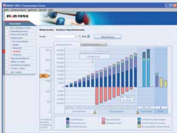
Der Zahlungsverlauf wird transparent und optisch ansprechend dargestellt.

Weitere Details zum Tool BRAIN FORCE Wohnriester sind in einem separaten Datenblatt erhältlich.